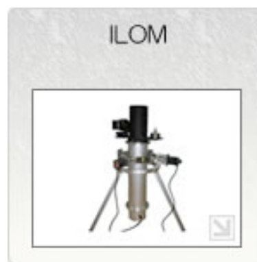
共同開発中の月面用観測器